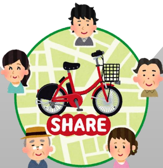
施設や他団体と共有する器材