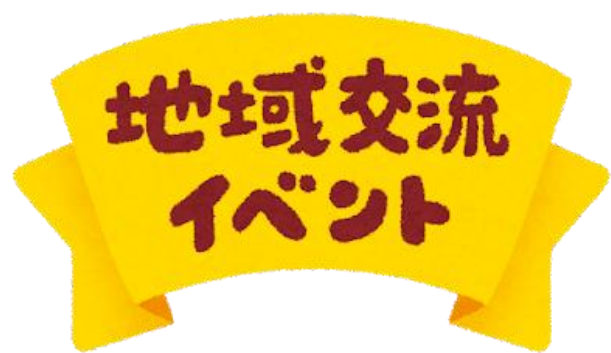
イベント開催費用