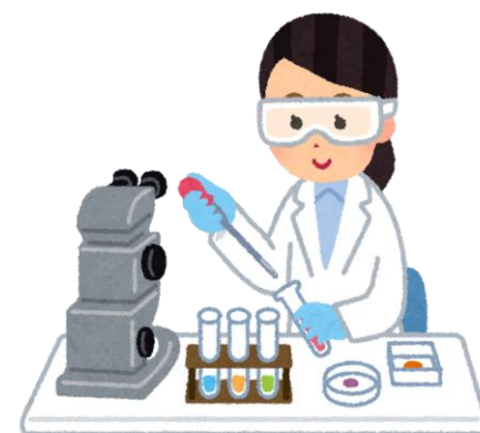
調査研究の器材・費用