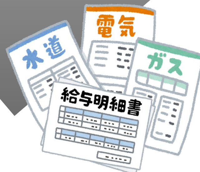
一般管理事務を行うための器材・費用