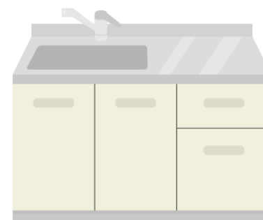
シンク等キッチン設備・洗面台・給湯器などの給排水設備及び冷暖房等空調設備等の住宅設備機器