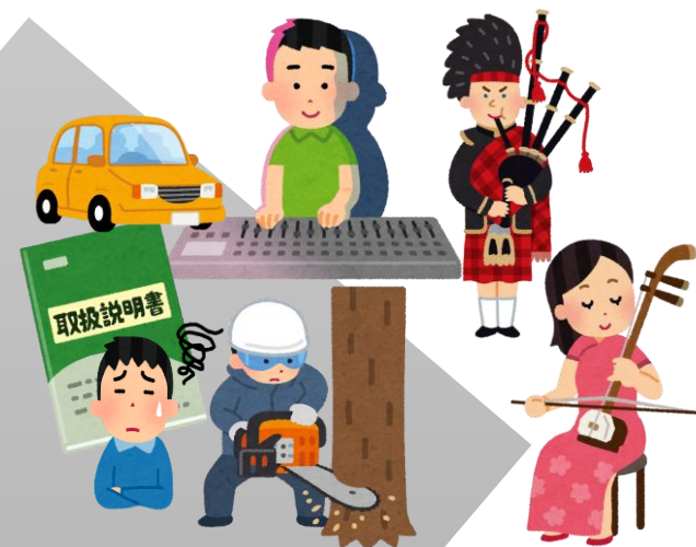
使用できる人が限定される器材・楽器等