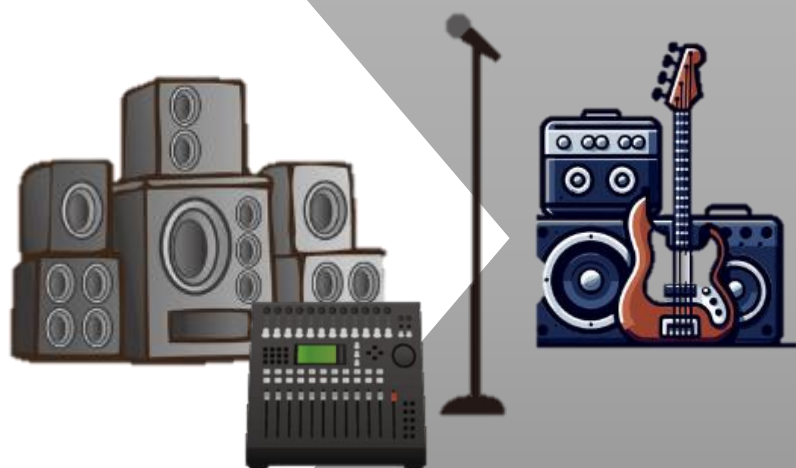
高出力アンプ・スピーカー等 その他イベント用器材・費用