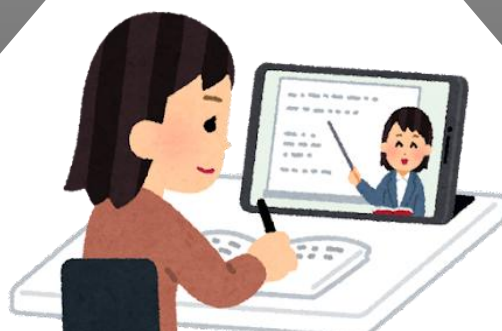
ボランティア研修・資格取得のための器材・費用 * 手話通訳者養成のための器材は含まない。