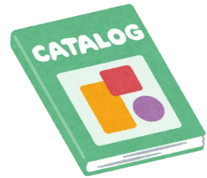
パンフレットカタログ