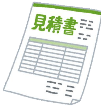
見積書 (相見積もり) (宛名は団体名)