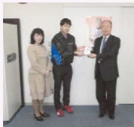
筑紫野市商工会 (青年部女性部)