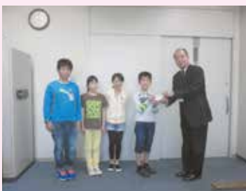
(特)ちくしの子ども劇場