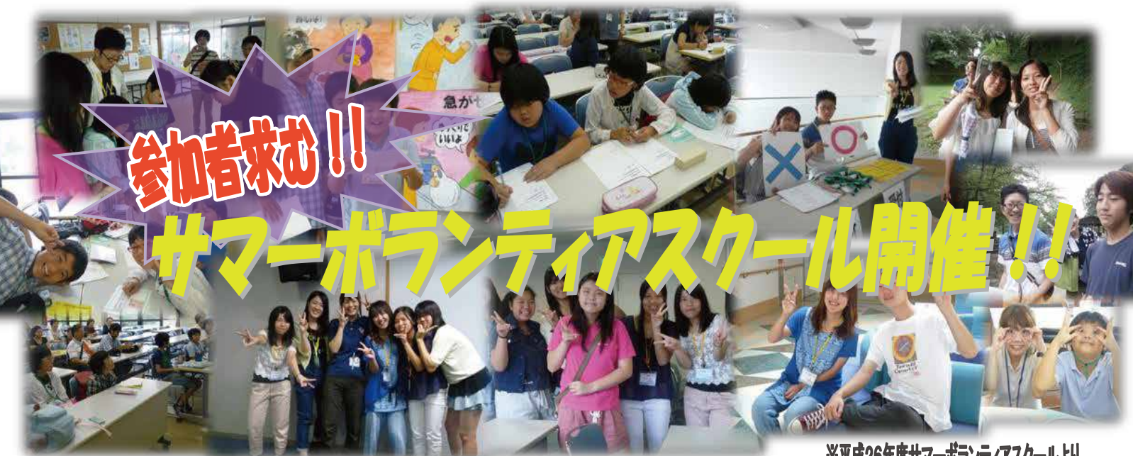
※平成26年度サマーボランティアスクールより